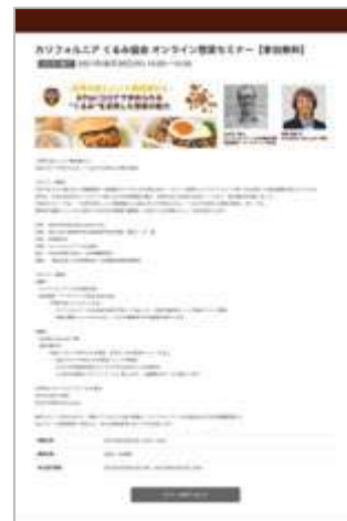
【申込サイトイメージ】